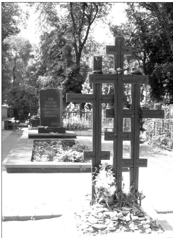
Пам'ятник розстріляним на 2-му Християнському кладовищі