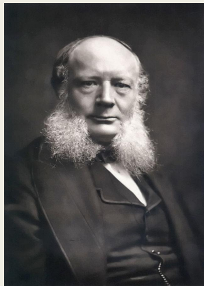
Вільгельм фон Сіменс