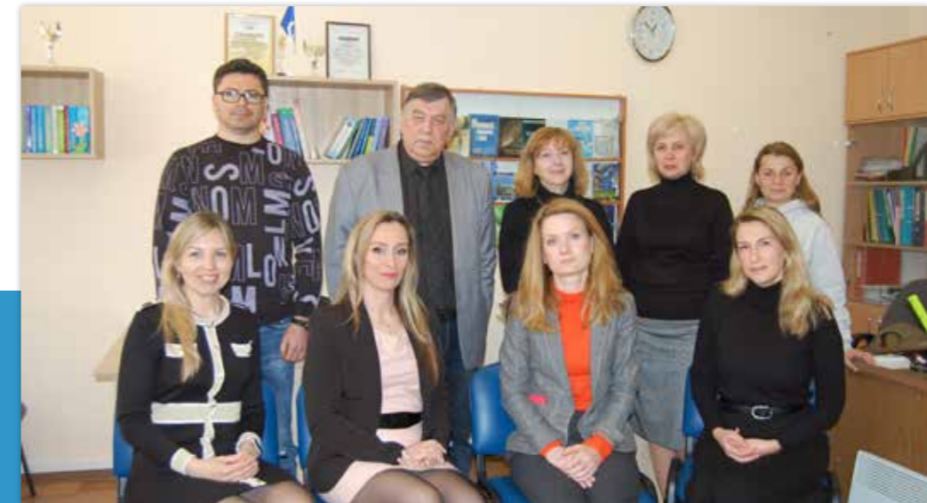
Колектив кафедри обліку і фінансів

Наукові інтереси кафедри свідчать, що вона працює в руслі новітніх напрямків розвитку економічної науки: соціально-економічних процесів у національному макроекономічному середовищі та характеристики фінансових інституцій та інструментів розвитку держави, територій та суб'єктів господарювання. У 2019–2023 роках викладачі і здобувачі працюють у межах наукової теми «Дослідження фінансових інституцій та інструментів розвитку держави, територій та суб'єктів господарювання: теоретичні, методологічні та практичні аспекти» (науковий