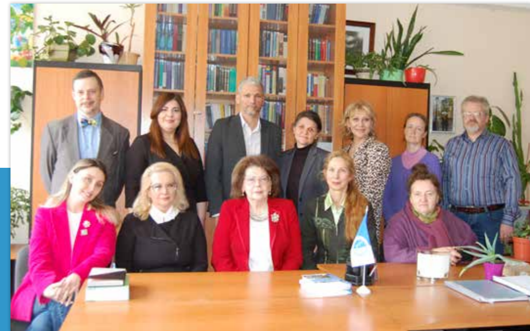
Колектив кафедри маркетингу та бізнес-адміністрування

Всі викладачі кафедри проходили стажування та підвищення кваліфікації у провідних університетах та бізнес школах світу серед яких: Центральний Європейський Університет (м. Будапешт), Kellogg Business