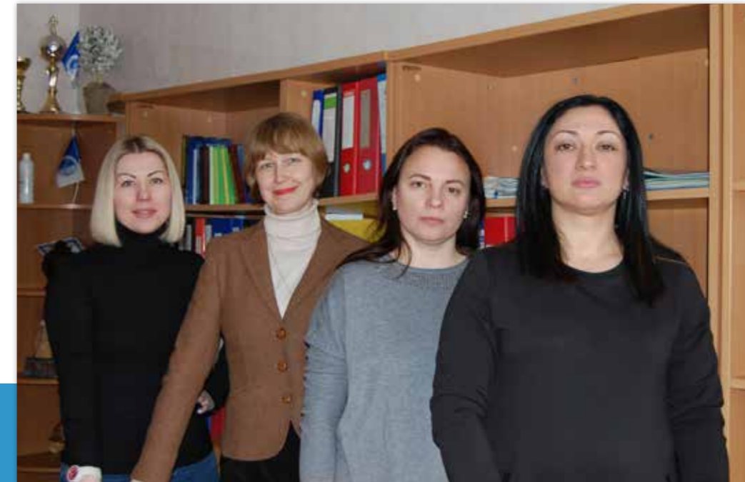
Колектив кафедри конституційного права та правосуддя