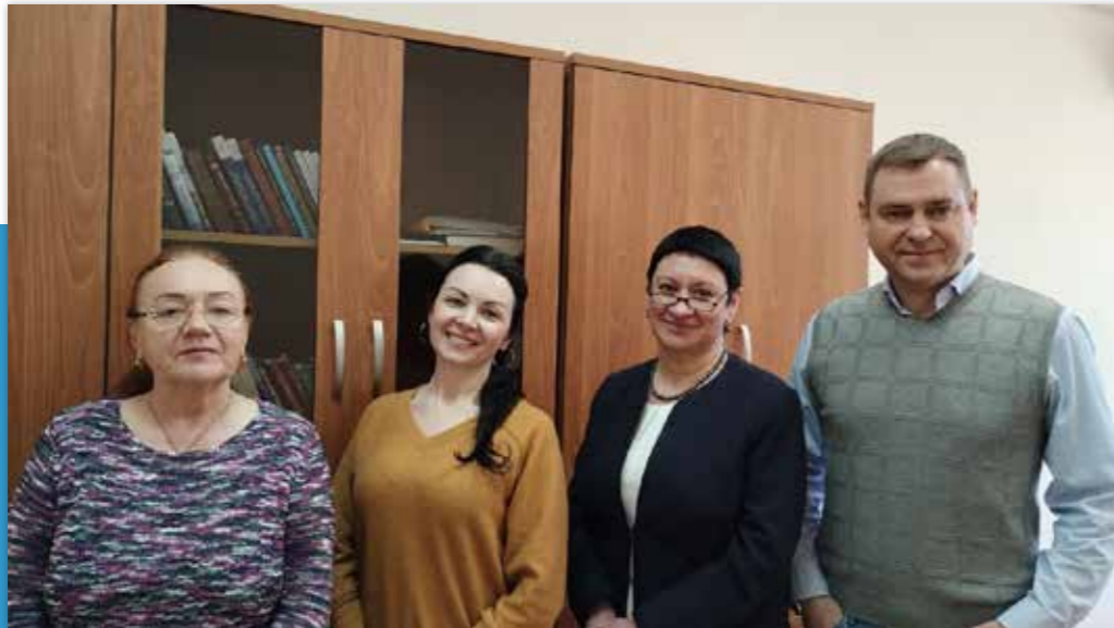
Колектив кафедри загальноправових дисциплін та міжнародного права

Науково-педагогічна діяльність викладачів кафедри неодноразово відмічалася грамотами університету, державними та відомчими нагородами на рівні Президента України, Міністерства освіти та науки України, Національної академії наук України, Одеської обласної державної адміністрації, Одеської міської ради.