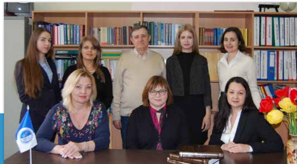
Колектив кафедри цивільно-правових дисциплін

Шевченка, НТУ «Дніпровська політехніка», КНЕУ імені Вадима Гетьмана, ДТЕУ, МНАУ, НУ «Чернігівська політехніка», ін.), які долучаються до обговорення освітніх програм, проведення відкритих лекцій і майстер-класів. На постійній основі здобувачі мають можливість долучитися до освітніх заходів НБУ, лекцій і тренінгів від представників компаній Ernst&Young, Deloitte, Morgan Stanley й ін. Викладачі кафедри є членами чисельних громадських і професійних організацій (Спілка економістів України, Асоціація економістів-міжнародників, American Economic Association, Українсько-Американська Асоціація працівників вищої освіти), виступають науковими консультантами та членами наглядових рад підприємств, організацій, державних установ.