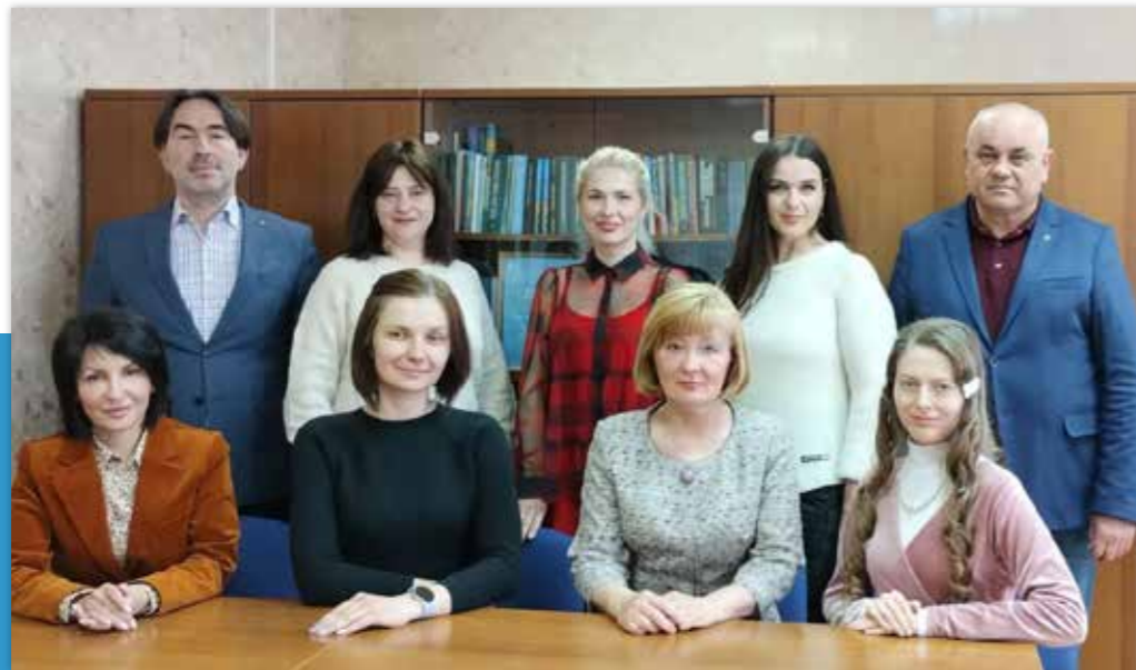
Колектив кафедри цивільно-правових дисциплін

Кафедра активно співпрацює з випускниками університету, роботодавцями, державними установами, науковцями України, які долучаються до обговорення освітніх програм, проведення відкритих лекцій і майстер-класів.