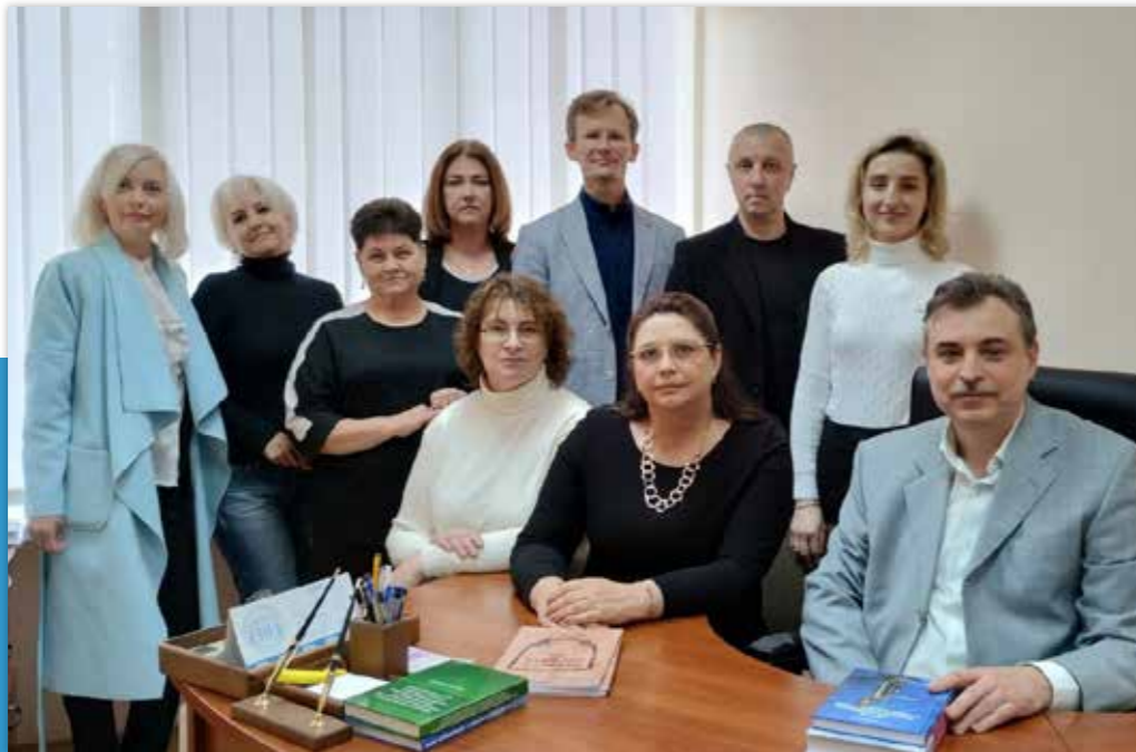
Колектив кафедри адміністративного та господарського права