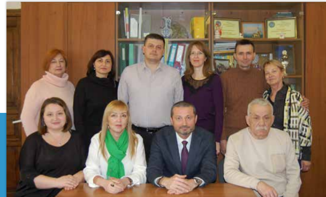
Колектив кафедри кримінального права, кримінального процесу та криміналістики

Професорсько-викладацький склад кафедри нагороджений почесними грамотами Одеської обласної державної адміністрації, Одеської обласної ради, подяками від Міністерства освіти і науки України за плідну науково-педагогічну діяльність.