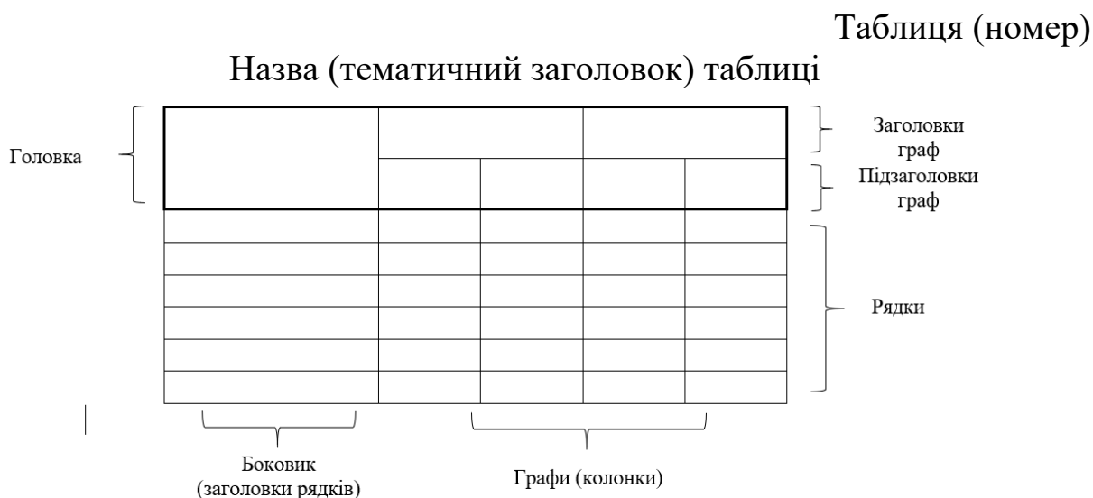
Рис. 3.2 Побудова та оформлення таблиць у роботах

боковику – як за їх центром, так і за шириною або за лівим краєм в залежності від змісту і виду цих рядків.