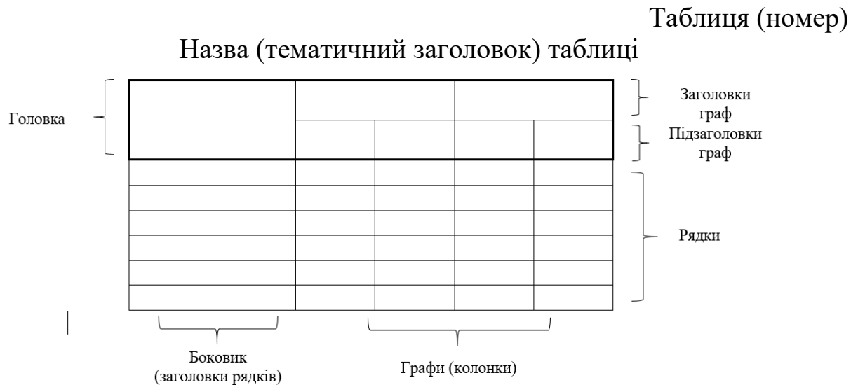
Рис. 3.2 Побудова та оформлення таблиць у роботах

Скрізь у таблицях допускається перенесення слів як у автоматичному режимі, так і ручним способом. Заголовки головки і рядків у боковику слід починати з великих літер, підзаголовки – з малих літер, якщо вони складають одне речення із заголовком, і з великих, якщо мають самостійний зміст. В кінці заголовків і підзаголовків таблиць крапки не ставлять. Не слід вводити до таблиць графу з порядковими номерами граф або рядків. А проте, заголовки рядків у боковику можна за необхідності нумерувати всередині комірок арабськими цифрами з крапкою після них і наступним текстом зазначених заголовків з великої літери без відступу від крапки.