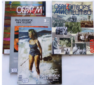
Лл. 6. Періодичні літературно-художні видання

ні мистецтвознавчі журнали, як «Образотворче мистецтво», «Галерея» та «Музейний провулок» (іл. 6). Керуючись методом суцільної вибірки, нами були переглянуті усі випуски цих журналів, представлені у фондах Наукової бібліотеки, на основі чого було доповнено бібліографічний список і статтями по окремим персоналіям митців. Отже, подаємо короткий огляд видань.