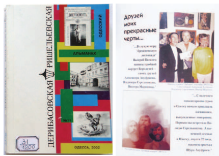
Іл. 7. Сторінками видання «Дерибасовская-Ришельевская»