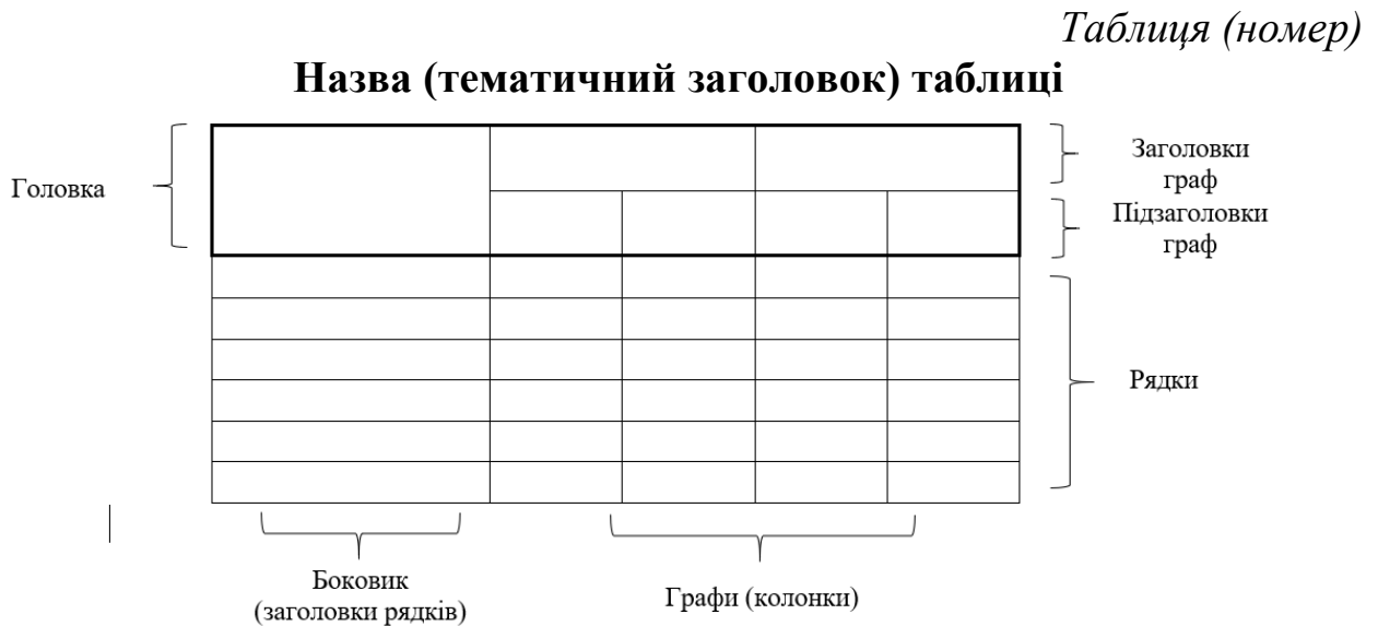
Рис. 3.2 Побудова та оформлення таблиць у роботах

загалом визначається детальністю і обсягом конкретних таблиць. Зображення шрифту при цьому для всіх елементів головки таблиці – напівгрубе, для інших елементів – звичайне. Вирівнювання тексту рядків таблиці (див. рис.3.2): для рядків головки і всіх граф таблиці – за їх центром, для рядків у боковику – як за їх центром, так і за шириною або за лівим краєм в залежності від змісту і виду цих рядків.