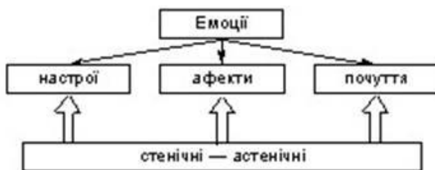
Рис. 4. Види емоцій.

Емоційні переживання можуть бути класифіковані. Так, розрізняють позитивні і негативні емоції (характеризуються наявністю відтінків задоволення або невдоволення). Емоції відрізняються також за ступенем збудження чи заспокоєння.